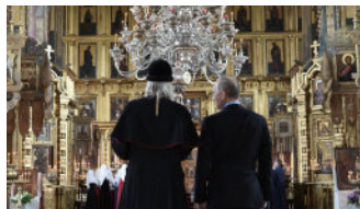
Президент Росії Володимир Путін (праворуч) і митрополит Московський і всієї Русі Російської православної старообрядної церкви Корнилій (ліворуч) відвідують Покровський собор

Але тепер він президент і явно дотримується іншої точки зору – і Російська православна церква є бенефіціаром.